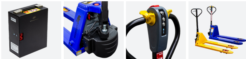
Uitneembare lithium-ion batterij